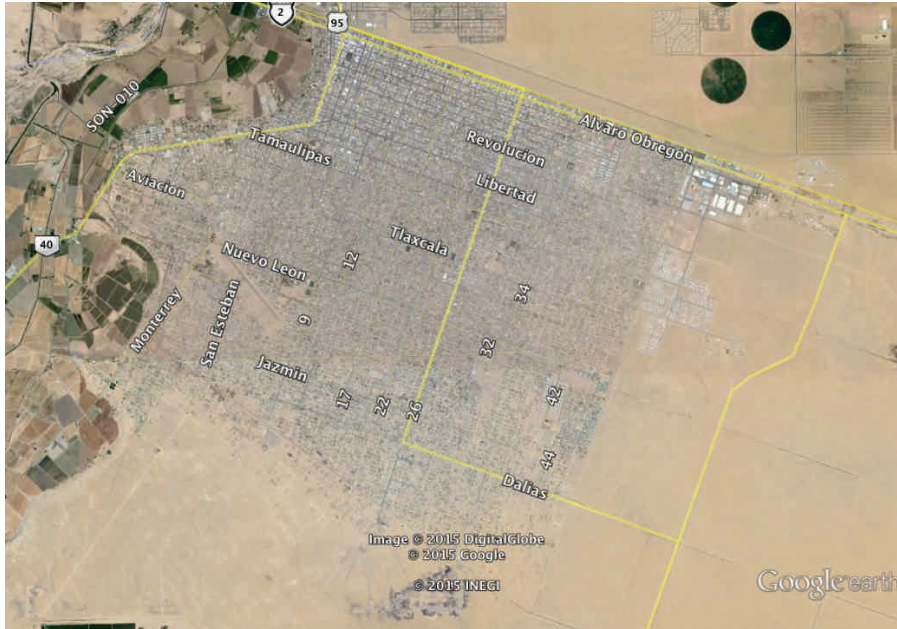
Google Earth 2015.